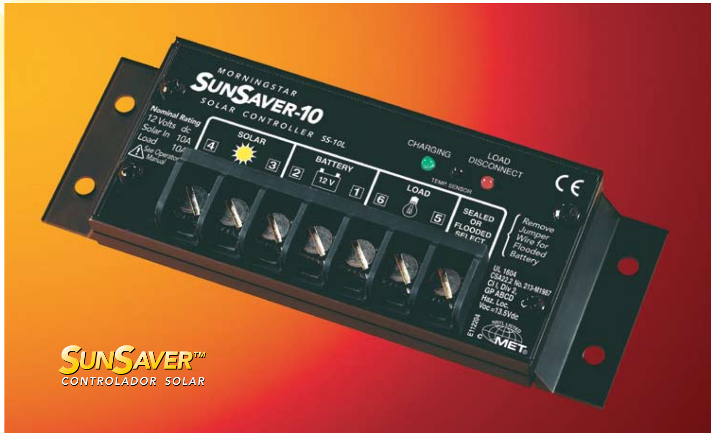
SUNSAVER™ CONTROLADOR SOLAR

El SunSaver de Morningstar es el controlador solar miniatura líder en el mercado para aplicaciones profesionales y del consumidor.